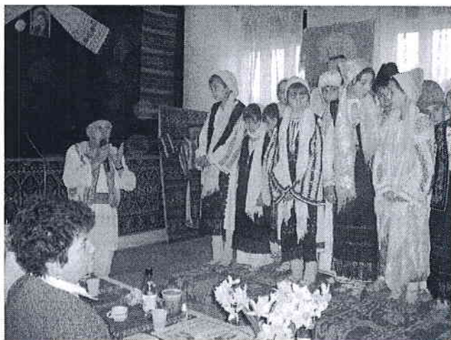
Pe scena Căminului Cultural din Pietrari.

În anul 1999, Căminul Cultural Păușești , ca instituție culturală reprezentativă pentru comunitate, a avut prima ieșire. A fost invitat să participe la Hora costumelor, manifestare culturală de importanță județeană, organizată de comuna Pietrari, jud. Vâlcea, unde costumele populare din Păușești au obținut diferite premii.