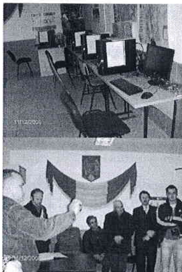
Imagini ale Biblionetului

Biblioteca reprezintă un factor de creștere a nivelului de cunoaștere și cultură generală a omului. Plecând de la această premiză s-a căutat ca în cursul anului 2010 să se organizeze activitatea bibliotecii în așa fel încât să-i confere caracterul de instruire și informare să poată avea un rol activ în dezvoltarea și creșterea nivelului de cultură generală a populației din comună.